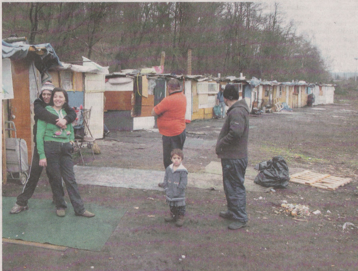
CHÂTENAY-MALABRY, HIER. Les Roms vivant dans le camp installé au bord de la N 118, sur un terrain appartenant au conseil général de l'Essonne, s'attendent à être expulsés d'un jour à l'autre par les forces de l'ordre.

Si une habitante vivant dans une maison à côté du campement ne semble guère incommodée par ces voisins embarrassants — « Je n'ai jamais eu de souci avec eux », déclare-t-elle —, leur présence provoque malgré tout quelques inquiétudes dans le secteur.